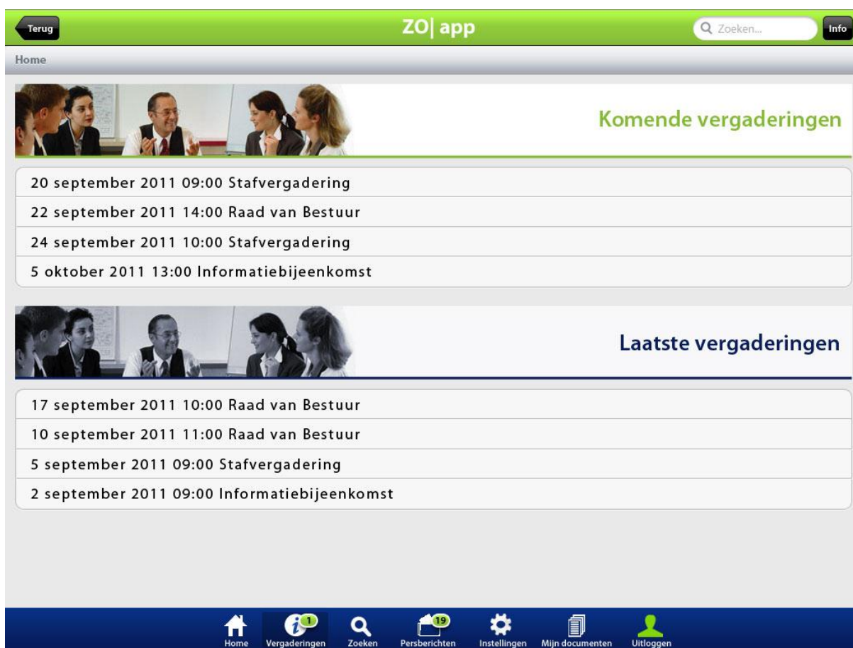
Startscherm ZO| app

Informatie van de ZO| app is altijd actueel. De App haalt alle vergaderinformatie realtime en automatisch via een webservice op. Web en iPad zijn dus altijd synchroon. De oplossing is naadloos aan te sluiten op ZO| raadsinformatie of uw eigen RIS, CMS of DMS. Bovendien is er onderscheid tussen openbare en besloten documenten. In de besloten omgeving kunt u de App tevens per orgaan indelen.